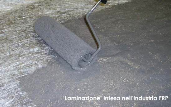
'Laminazione' intesa nell'industria FRP