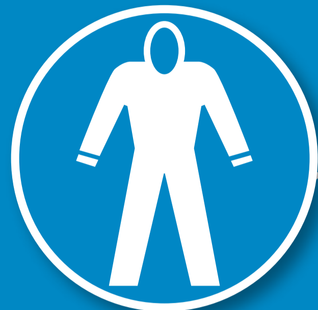
Schutzanzug mit Kapuze