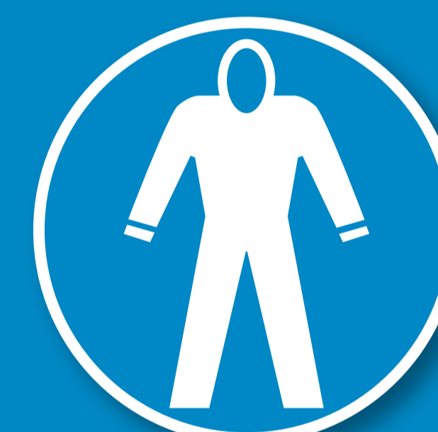
Schutzanzug mit Kapuze