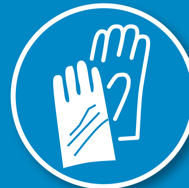
Handschuhe mit Schnitenschutz