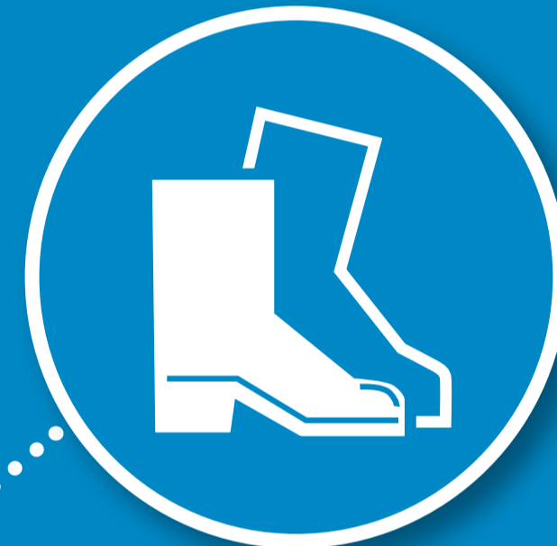
Chaussures de sécurité