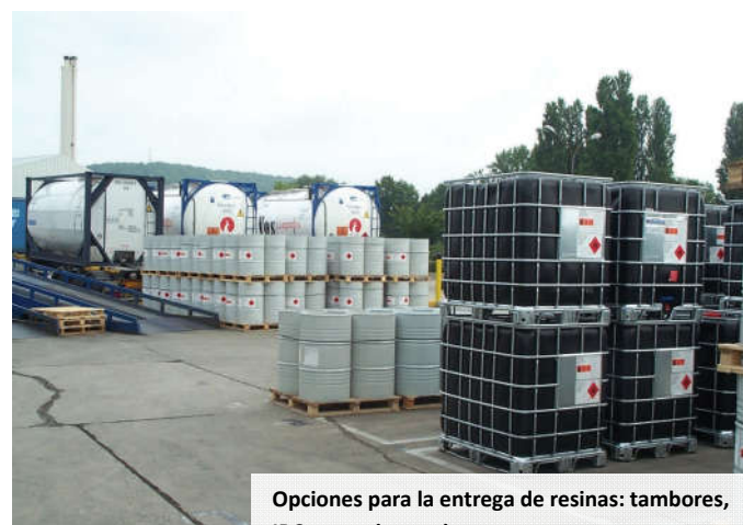
Opciones para la entrega de resinas: tambores, IBCs y camiones cisterna