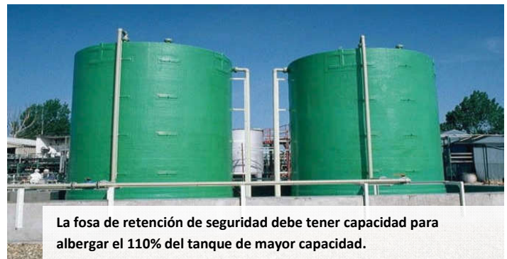
La fosa de retención de seguridad debe tener capacidad para albergar el 110% del tanque de mayor capacidad.

Durante el manejo de líquidos inflamables está estrictamente prohibido fumar o usar llamas descubiertas en el área de descarga.