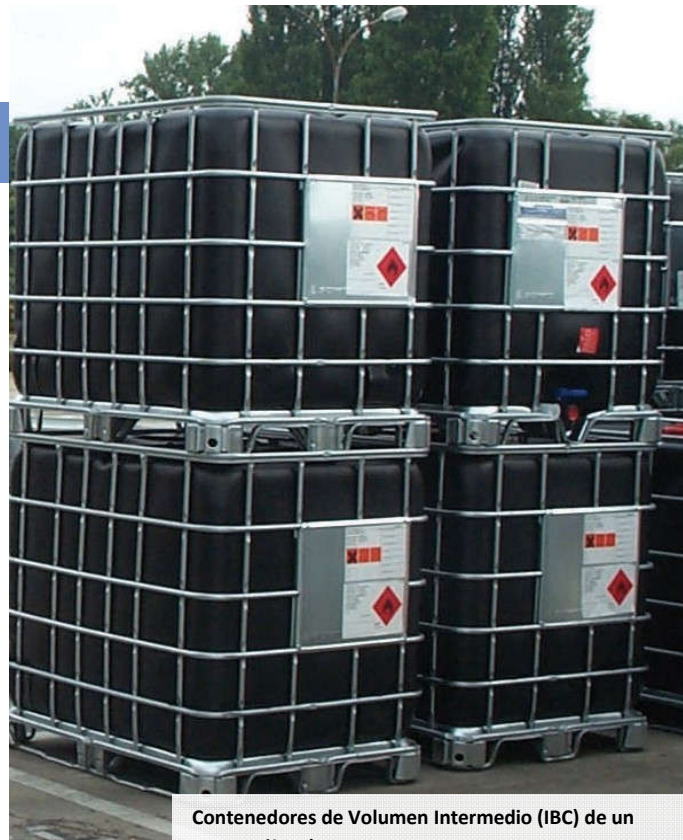
Contenedores de Volumen Intermedio (IBC) de un metro cúbico)