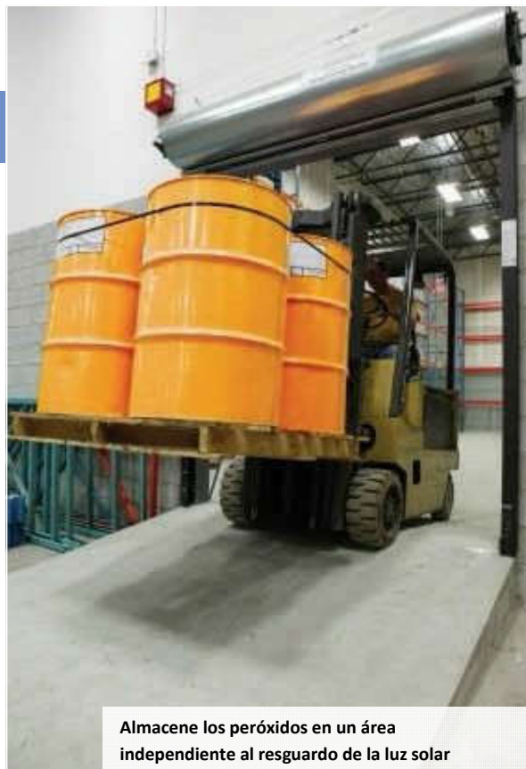
Almacene los peróxidos en un área independiente al resguardo de la luz solar

Los vertidos deben limpiarse inmediatamente. Para limpiar vertidos menores, pueden utilizarse papeles o paños, pero posteriormente han de ser desechados en contenedores ignífugos. Para vertidos más abundantes, debe emplearse un material absorbente inerte, como la vermiculita. Este material debe remojar en agua después de la operación de limpieza, y posteriormente depositado en un contenedor de residuos ignífugo. En caso de vertido de peróxido sobre la ropa de trabajo, retirar la ropa afectada de inmediato. En el manejo de peróxidos debe utilizarse siempre protección ocular. Las salpicaduras de peróxido en los ojos son altamente dañinas, por lo que, si esto ocurre, enjuáguelos inmediatamente con abundante agua durante al menos 15 minutos, y consulte siempre a un médico.