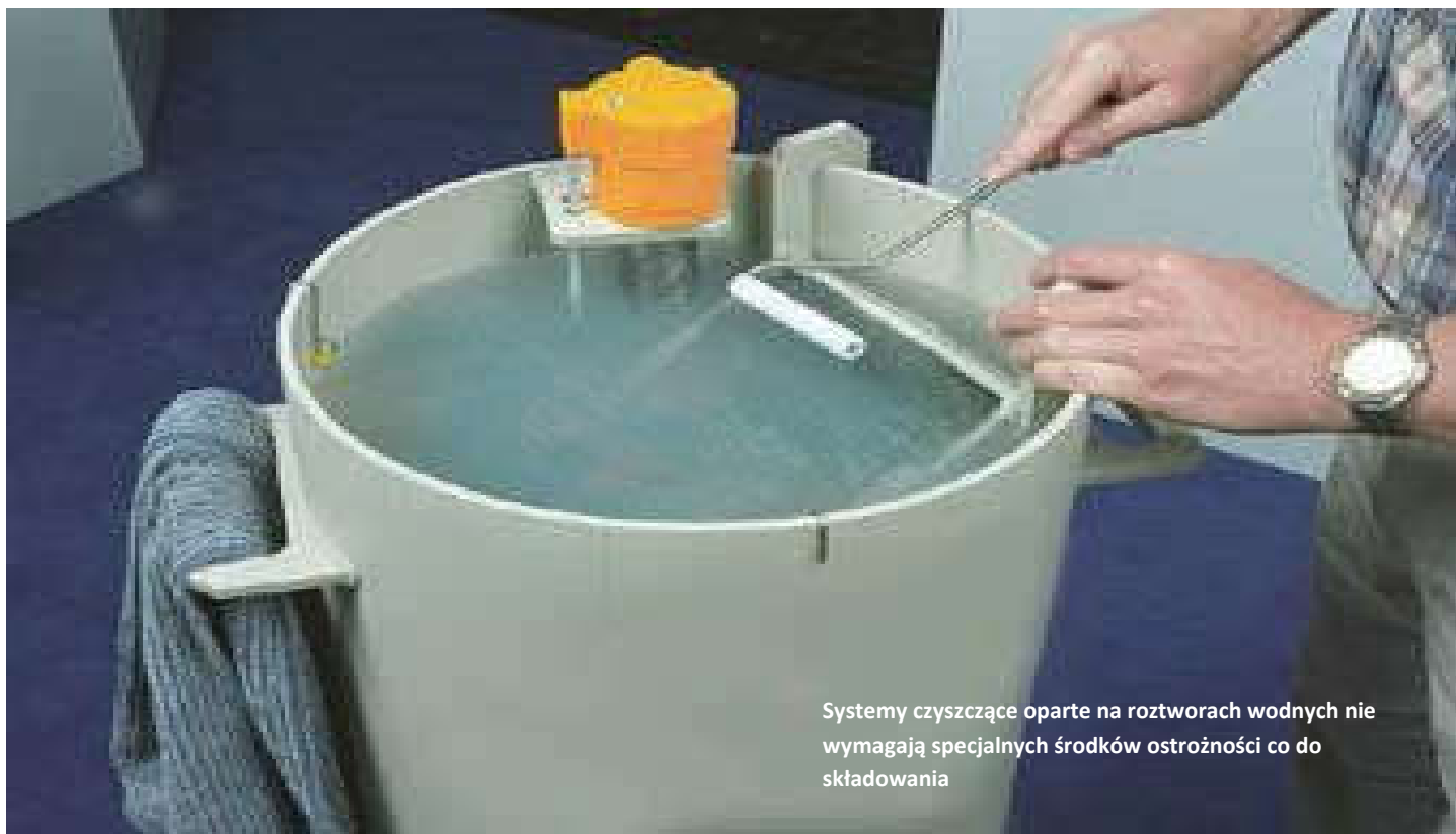
Systemy czyszczące oparte na roztworach wodnych nie wymagają specjalnych środków ostrożności co do składowania

Odpady ze środków czyszczących należy przechowywać w zamkniętych pojemnikach by zapobiec wyparowaniu.