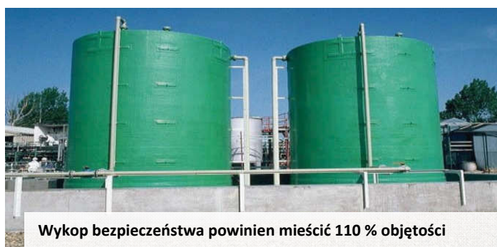
Wykop bezpieczeństwa powinien mieścić 110 % objętości

W obszarze rozładunku w trakcie obchodzenia się z łatwopalnymi płynami zabronione jest palenie i korzystanie z otwartego ognia.