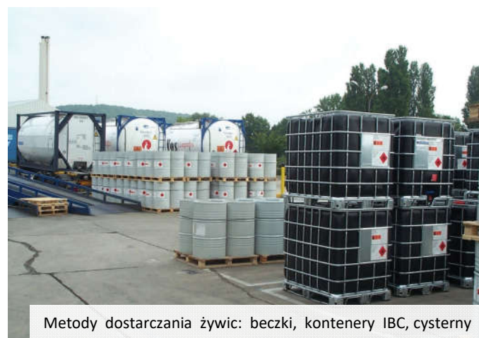
Metody dostarczania żywic: beczki, kontenery IBC, cysterny